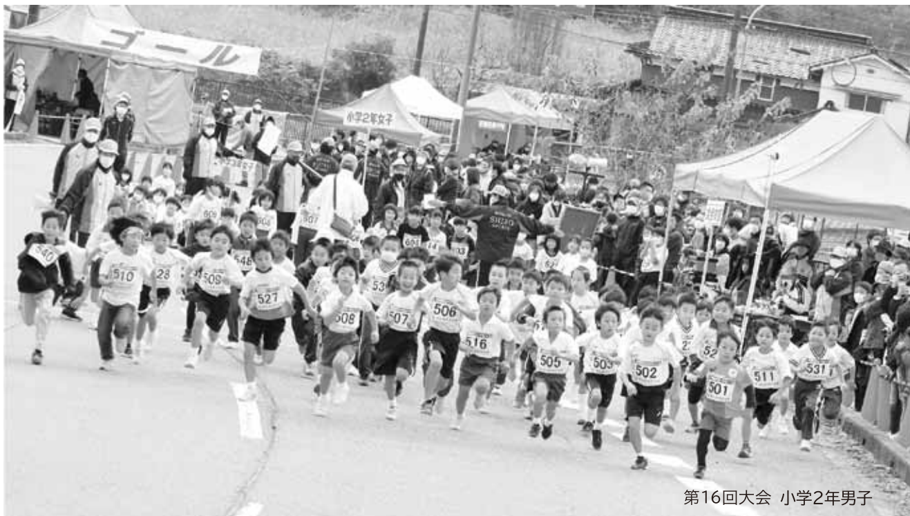
第16回大会 小学2年男子